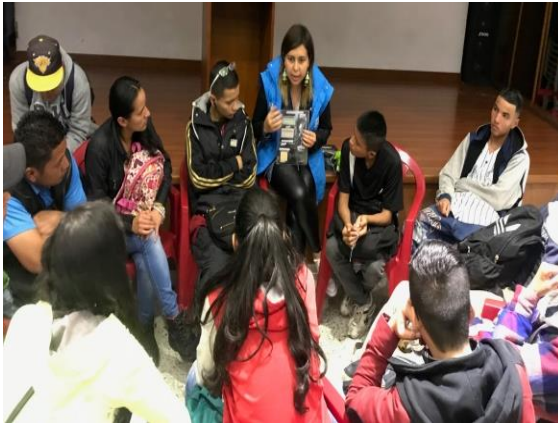
Grafica 7. Socialización Métodos de planificación Modernos Jóvenes de la localidad.

Crear espacios de participación juvenil en el marco de un proceso de abordaje integral en salud implica un reto no solo en términos de recursos y talento humano, sino también un reto en términos de llegar a los jóvenes de la localidad con sus necesidades, expectativas, formas de ser etc. y teniendo en cuenta que las tensiones identificadas para el ciclo juventud desde el sector salud están asociadas a medio en el cual viven y los estilos de vida. Desde la subred sur la apuesta de un parche amigable está encaminada a promover el mantenimiento de la salud de los jóvenes, con un enfoque diferencial y sin barreras de acceso, para esto es necesario que todos los actores involucrados estén capacitados para el abordaje de este ciclo de vida.