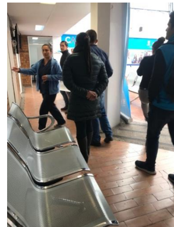
Grafica 3. Recorrido centros SISAJ

A su vez se realiza el proceso de identificación de mapa de actores por cada uno de los espacios de vida, identificación de recursos en términos de talento humano y físicos para la ejecución de la iniciativa en este sentido se propone el ajuste físico de la sede para lograr una propuesta que sea atractiva para los jóvenes desde que ingresa al servicio de salud, en la atención del personal de salud, en la sala de espera, hasta su salida del servicio; Se construye un plan de acción que permita dar seguimiento a las acciones de formulación de la iniciativa. Se realiza un recorrido por las sedes SISAJ ( Vista Hermosa y Betania ) reconociendo los espacios de consulta con enfoque diferencial que existen en la subred sur para los jóvenes, logrando tener la experiencia de consulta que reciben los jóvenes por parte del profesional de enfermería en termino de