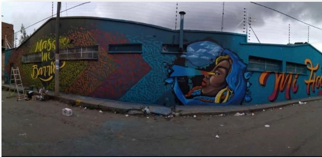
Grafica 1. Graffiti Centro Juvenil PARCHE AMIGABLE