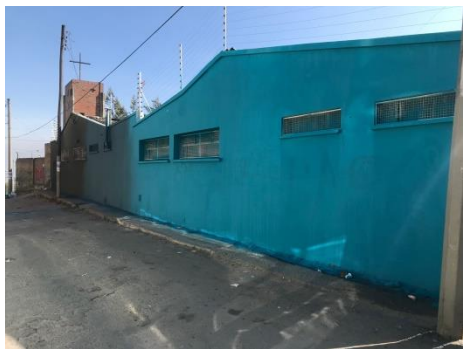
Grafica 4. Centro Juvenil

salud sexual y reproductiva y métodos anticonceptivos modernos; Socialización de rutas de las 2 oportunidades juveniles , haciendo énfasis en las rutas que hacen parte central del sector salud : 1. Adolescentes y jóvenes cuentan con la garantía del derecho a tener afiliación al Sistema General de Seguridad Social en Salud , 2. Jóvenes cuentan con Atención Integral en Salud, 3. Adolescentes y jóvenes viven su sexualidad protegida, planeada y placentera en ejercicio de los derechos humanos, sexuales y reproductivos , 4. Adolescentes y jóvenes tienen su derecho a la vida,