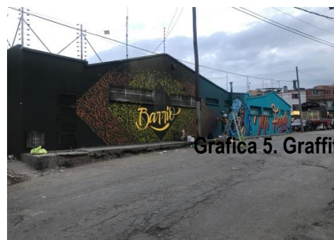
Grafica 5. Graffiti Centro Juvenil

En el marco del desarrollo de la iniciativa se realiza un proceso de articulación con barrios promotores y el colectivo survamos de la localidad de Ciudad Bolívar, donde se genera y ejecuta la propuesta de intervención artística por parte de los jóvenes en una de las sedes de la subred sur en el marco del festival anual Museo Libre que promueve el mismo colectivo en la localidad, esto en línea con el enfoque de la iniciativa que pretende brindar encuentros que promuevan la participación social, formación a los y las jóvenes, que permita fortalecer el desarrollo de sus habilidades sociales y derechos; Consolidando redes que identifiquen y promuevan los servicios integrales de salud. A través de este proceso de intervención realizado los días 23 y 24 de Noviembre en el marco del festival museo libre del colectivo survamos , se logra la socialización de servicios de salud que se brindan desde la subred sur para jóvenes y población en general. Se dan a conocer las sedes SISAJ en especial para la localidad de Ciudad Bolívar la sede Vista Hermosa y como valor agregado la posibilidad de agendamiento de citas en estas sedes a través de la plataforma sexperto .