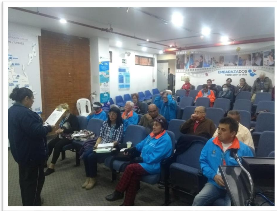
Noviembre: socialización de portafolio de red de servicios de EPS Capital Salud

ALCALDÍA MAYOR DE BOGOTÁ D.C. SALUD Subred Integrada de Servicios de Salud Sur E.S.E.