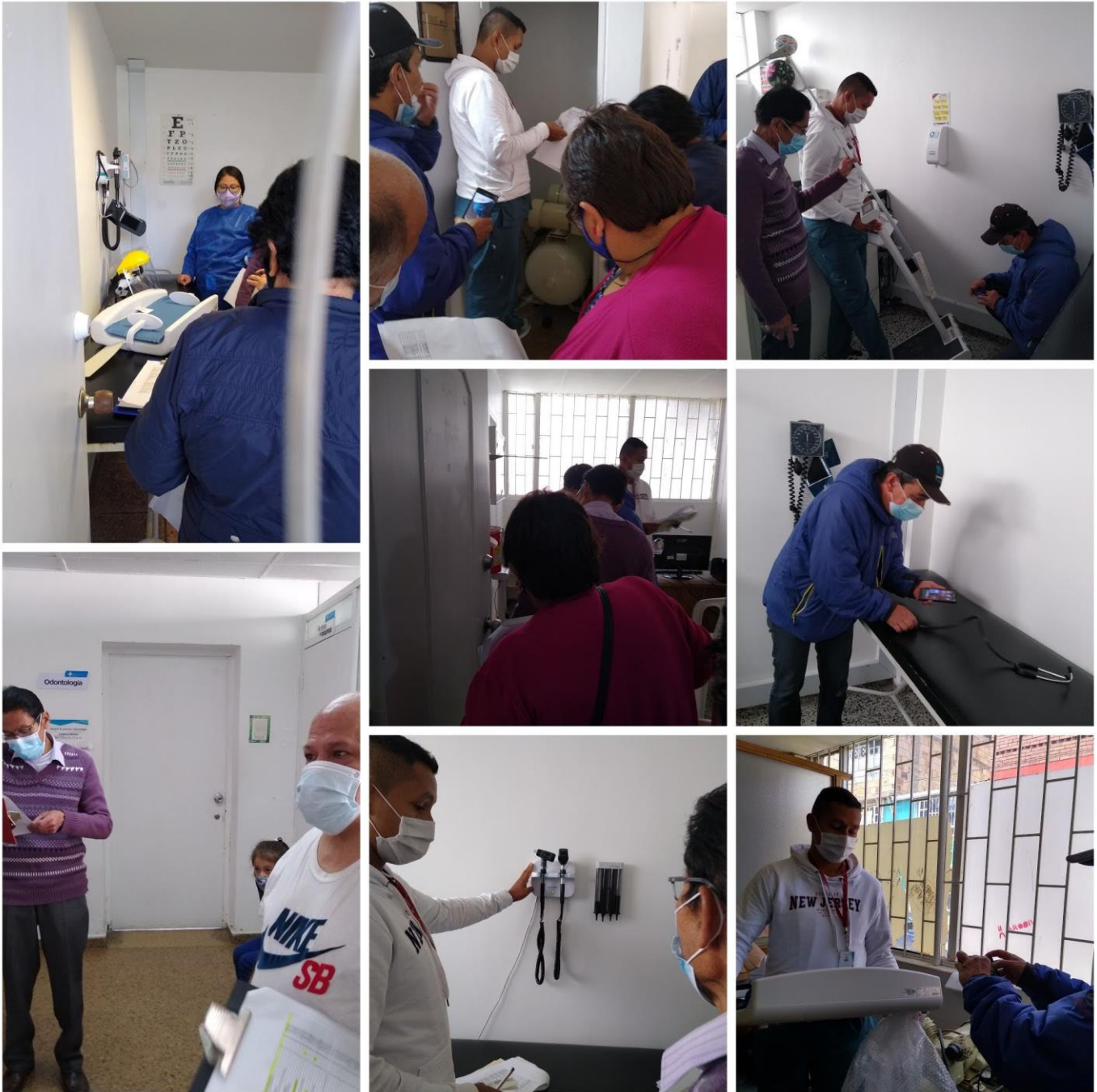
Algunas imágenes de recorrido en USS Yomasa