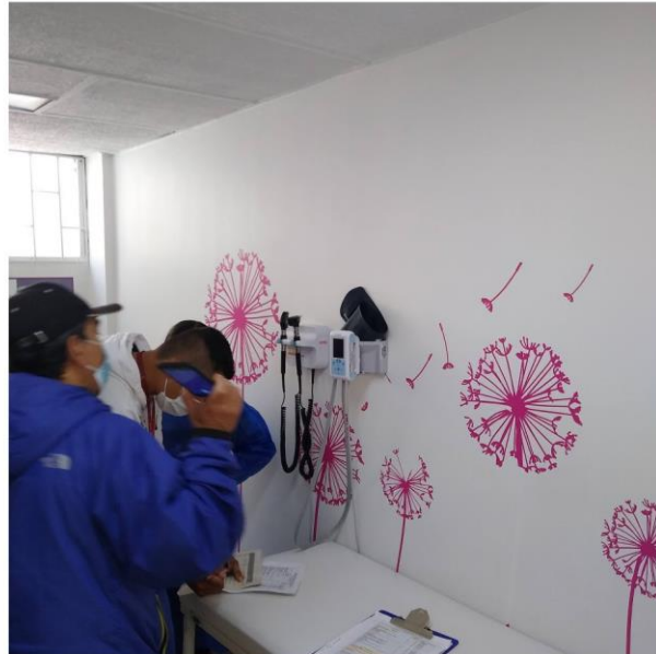
Algunas imágenes de recorrido en Betania