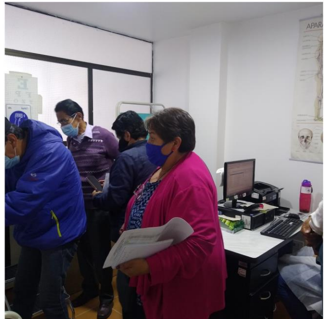
Algunas imágenes de recorrido en Danubio