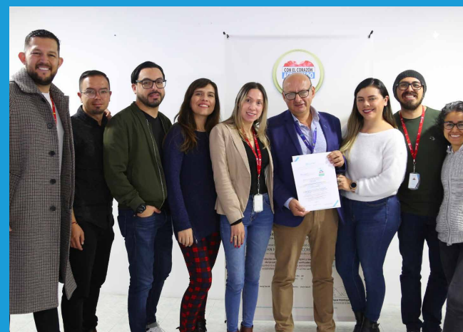
Seis Centros de Atención en Salud de la Subred Sur fueron acreditados por el ICONTEC.