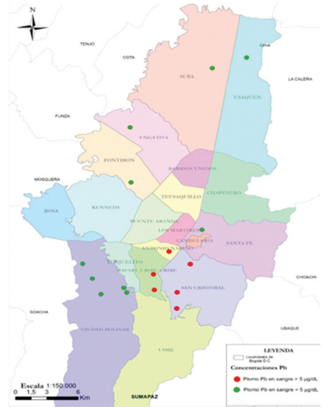
Figura 2. Menores de 17 años con concentraciones de plomo por exposición ambiental en Bogotá

a San Cristóbal, Rafael Uribe Uribe y Antonio Nariño (figura 2).