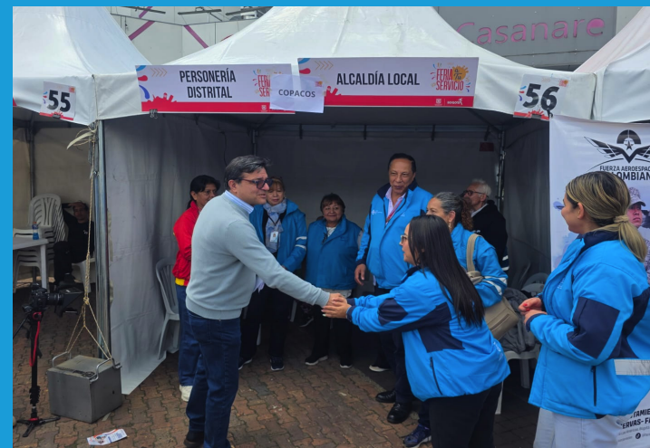
Visita del Secretario Distrital a Usme