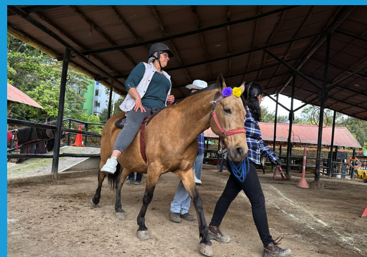
Terapia asistida con animales