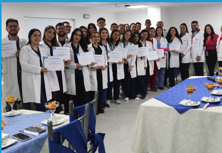
Estudiantes internos en Meissen