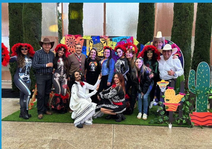
Cierre de Gestión 2025